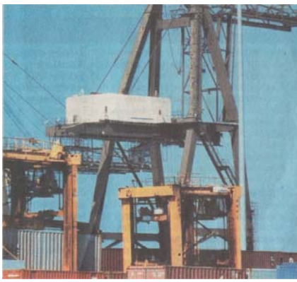
La logística incluye muchos aspectos, como la seguridad, para que la mercancía llegue bien a su destinatario final.